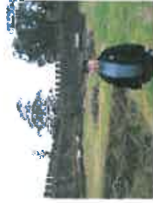
Utsnitt av romersk

festningsanlegg. Ved å bruke Google Earth og finne fram til luftbildene vest av Batumi, kan en så akkurat litt lengre vest langs hovedveien til Sarpi ved grensen til Tyrkia. En vil fort se den tyrkiske romerske kremlifuren som ble brukt av de romerske legionene når de bygget sine fort.