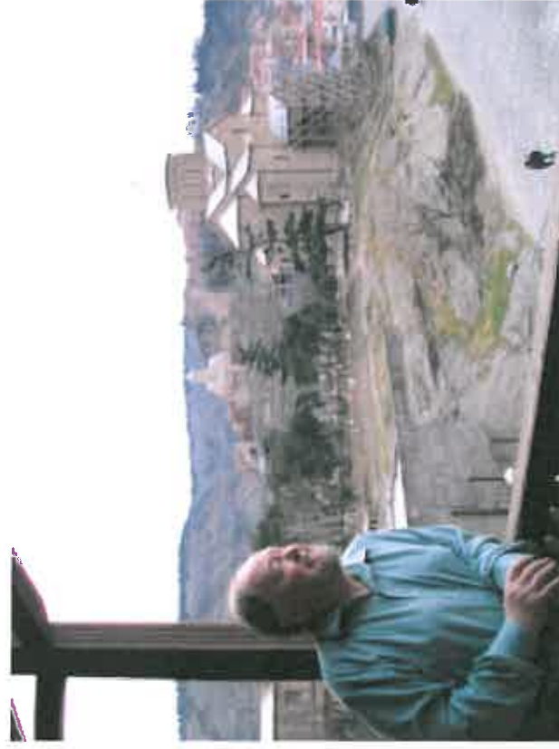
Hotel Kopala, Tbilisi: Nedentor kirken ligger gamlebyen i Tbilisi.