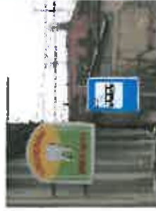
Teatretor Casca, Riga